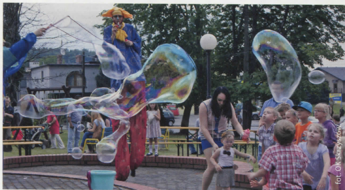
Wspólne zabawy na pikniku