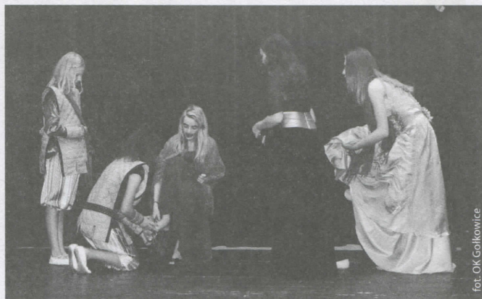
Scena z Kopciuszka