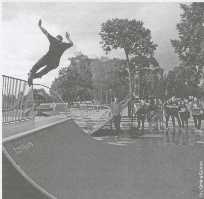
Skejterzy z Chałupek