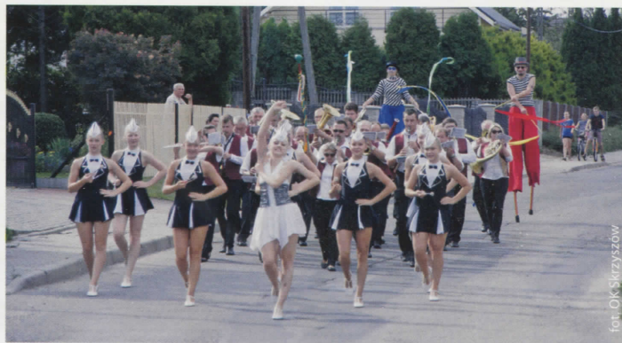
Parada mażorettek i orkiestry