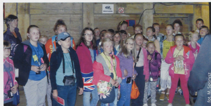
W zabytkowej kopalni soli