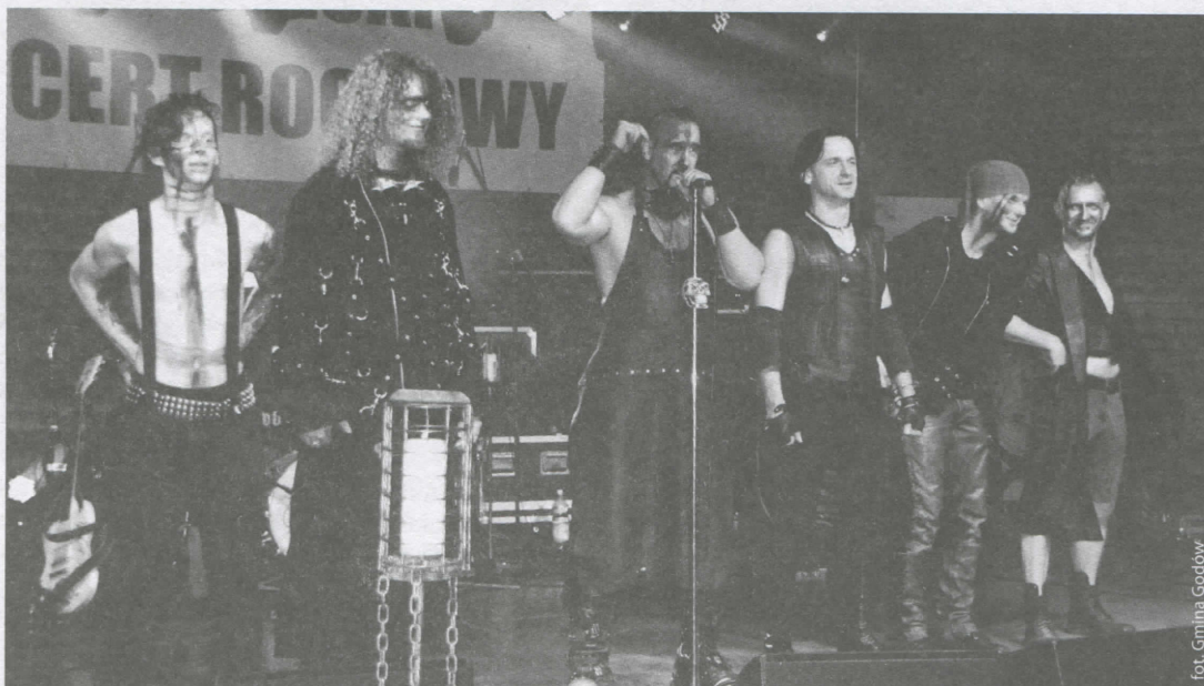
Oberschlesien w czasie występu