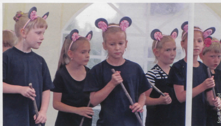
Młodzi artyści w akcji