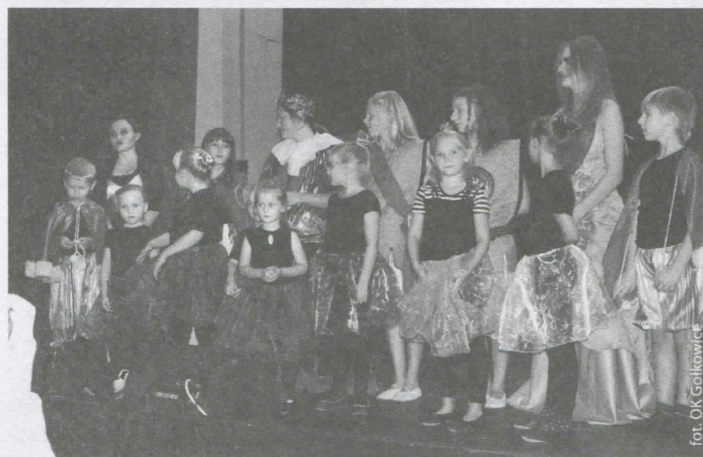
Zespół młodych aktorów

Plastycznie, teatralnie, tanecznie, kinowo i śpiewająco. Tak było w tym roku na wakacjach z gołkowskim ośrodkiem kultury. Wszystkie zajęcia w ramach wakacji były bezpłatne i przyciągnęły liczne grono stałych uczestników. Największą frekwencją cieszyły się środowe bajkowe seanse kinowe oraz kończący wakacje spektakl Teatru Naszej Wyobraźni i dzieci z zespołu Anawa pt. „Kopciuszek”.