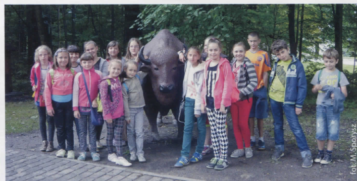
Z pszczyńskim żubrem