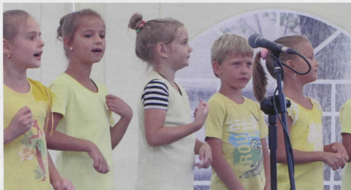
Występ zespołu Wiolinki