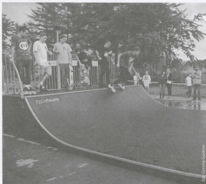
Grupa COOL TEAM