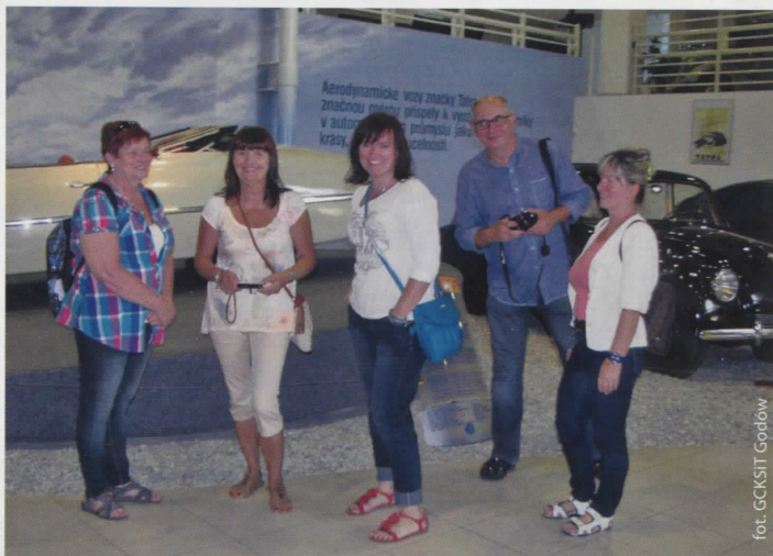
W Muzeum Techniki Tatra