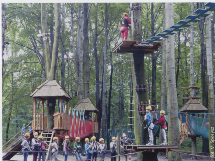
Park linowy w Radlinie