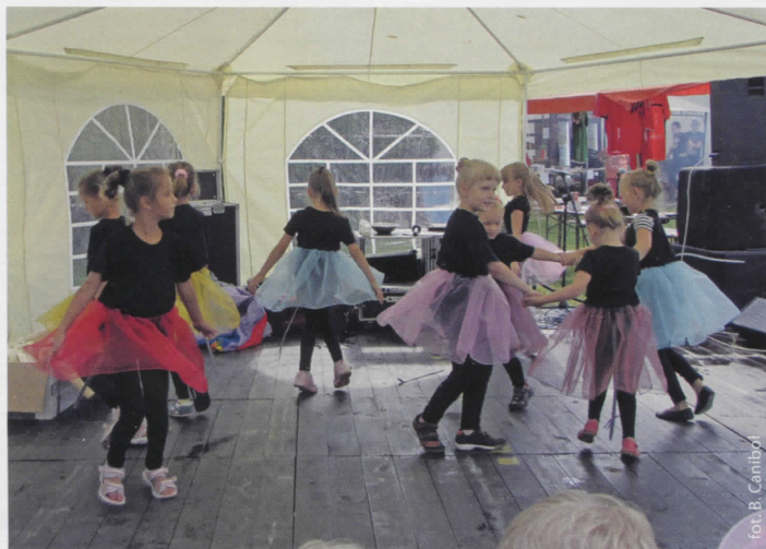
Anava w czasie występu